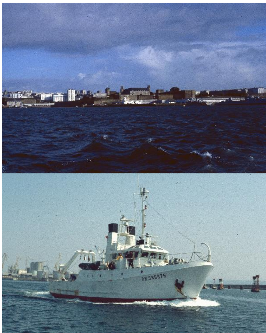
Avril 1979: programme ECORADE en rade de Brest avec le navire côtier Thalia du CNEXO.