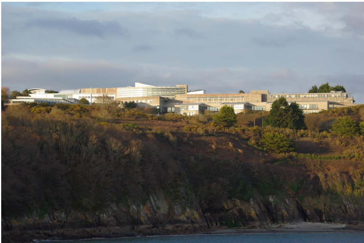
Bâtiments de l'Institut Universitaire Européen de la Mer, à la sortie de la rade de Brest.