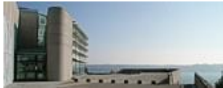
Entrée des bâtiments de l'IUEM, face à l'ouest

(1) une entrée centrale ouverte l'ouest, face aux vents dominants, en forme de U, particulièrement favorable à la génération d'un puissant tourbillon ce qui, en cas de tempête, peut jeter un homme au sol; ceci nous amènera à la condamner temporairement pour privilégier une entrée latérale côté nord, dite "porte tempête".