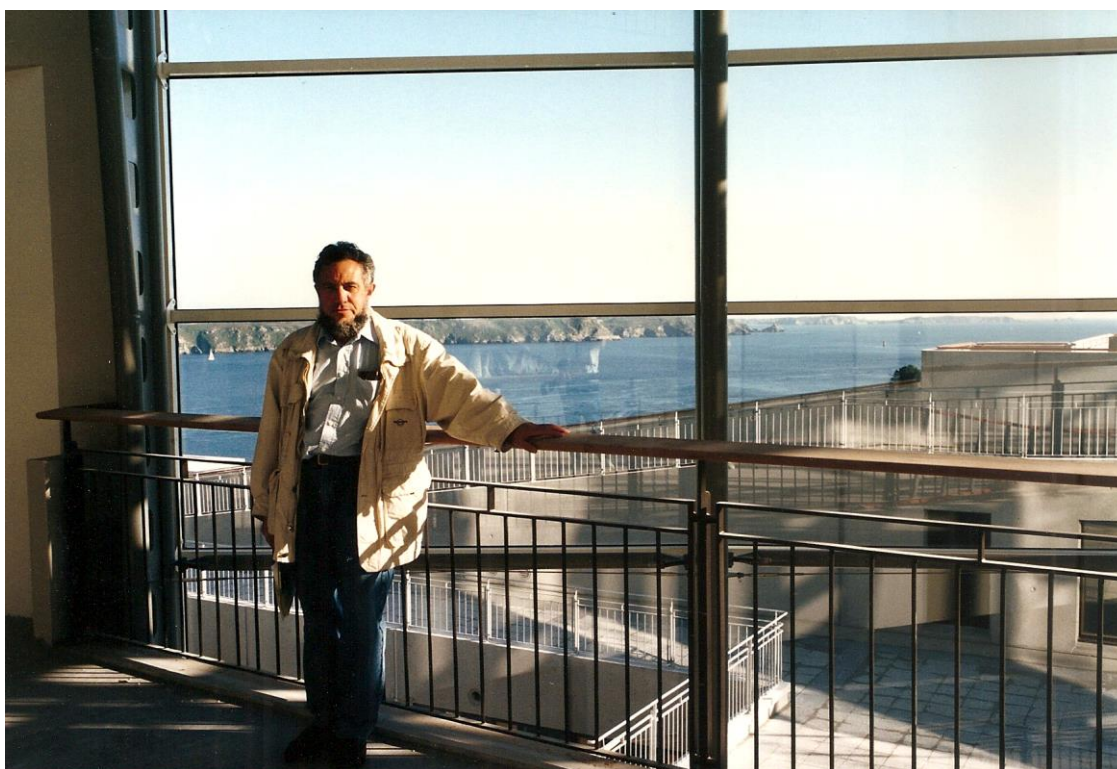
Août 1997: le chantier immobilier de l'IUEM n'est pas loin d'être achevé. Le déménagement des équipes de recherches va pouvoir commencer à l'automne 1997.