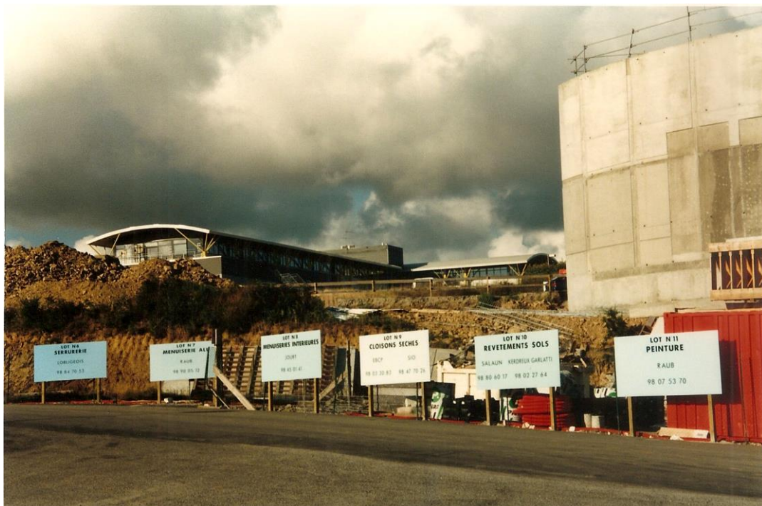
Août 1996: le chantier de l'IUEM progresse, à 50 m des bâtiments de l'Institut Français de Recherches et Technologies Polaires (renommé Institut Paul - Emile Victor), en arrière plan